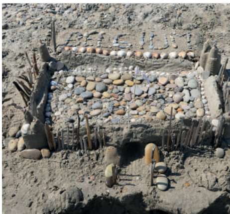
Concours de château de sable 2022