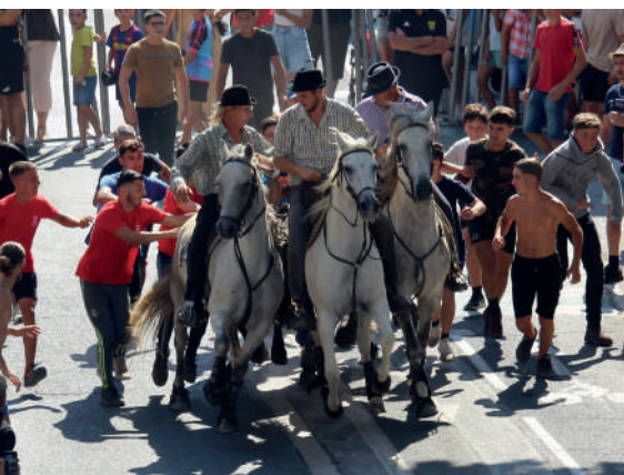
Bandido, fête locale