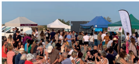
Les estivales 2023