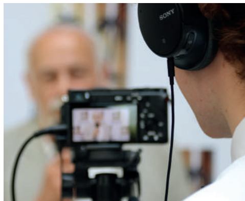
Festival Jeunesse en court 2023

21h / Cathédrale de Maguelone, Grande Nef