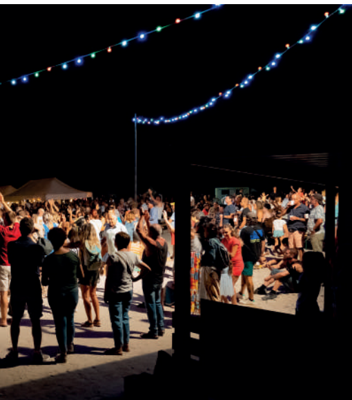
Fête de la mer 2022