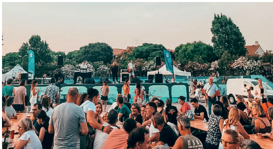
Fête de la musique 2023