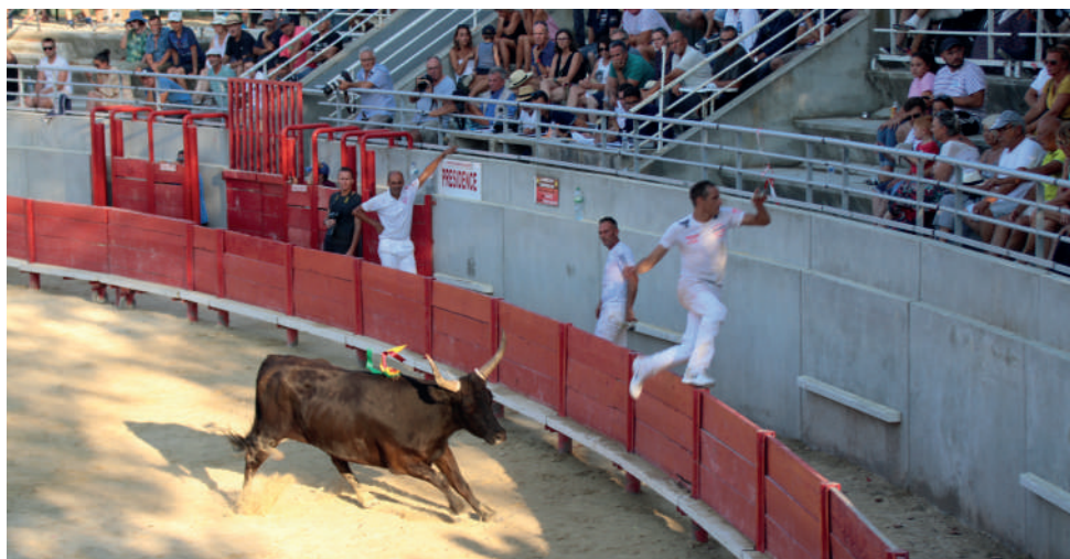
Course camargaise, arènes municipales