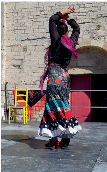
Spectacle de flamenco, féria des vendanges