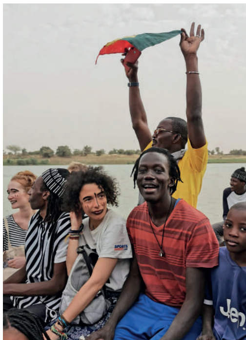
Hôtel Formule