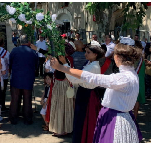
Cérémonie officielle, fête locale