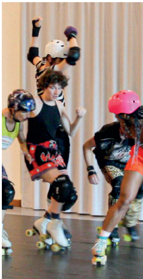
© Compagnie Lududo - Marta Izquierdo Muñoz