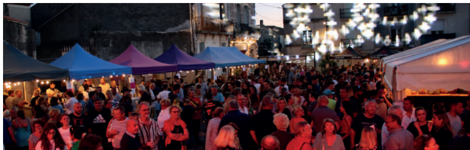
Soirée bodégas, féria des vendanges