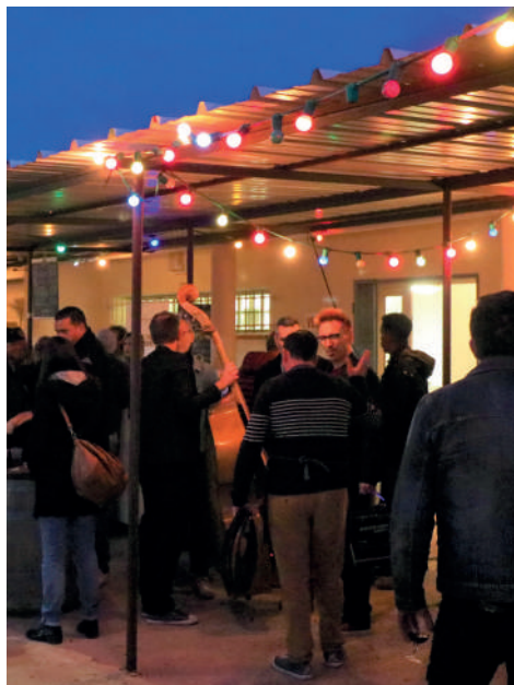
Les Epicures de Maguelone